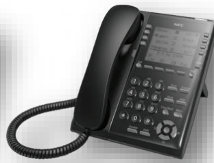
โทรศัพท์ IP รุ่น 8 ปุ่ม