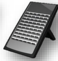
DSS คอนโซล 60 ปุ่ม