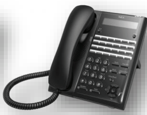
โทรศัพท์ดิจิทัลรุ่น 24 ปุ่ม