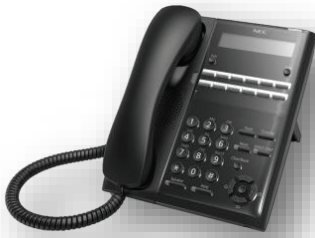
โทรศัพท์ดิจิทัลรุ่น 12 ปุ่ม